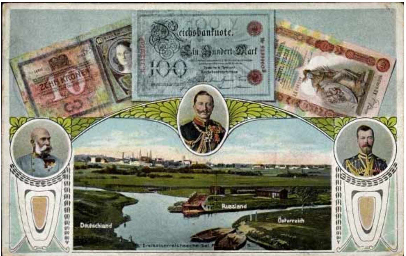
Mysłowitz, het Driekeizerpunt