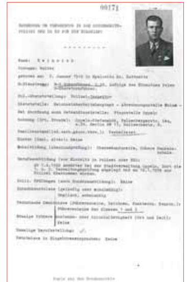
Eerste pagina dossier Bundesarchiv Berlijn

Na de Duitse bezetting van Nederland volgden bestuurlijke benoemingen. Arthur Seyss-Inquart (1892-1946) werd aangesteld als Reichskommissar für die besetzten niederländischen Gebiete , Hanns Rauter (1895-1949) benoemd tot Höherer SS und Polizeiführer en Generalkommissar für das Sicherheitswesen , en Wilhelm Harster (1904-1991) werd Befehlshaber der Sicherheitspolizei und des SD . In het voorjaar van 1941