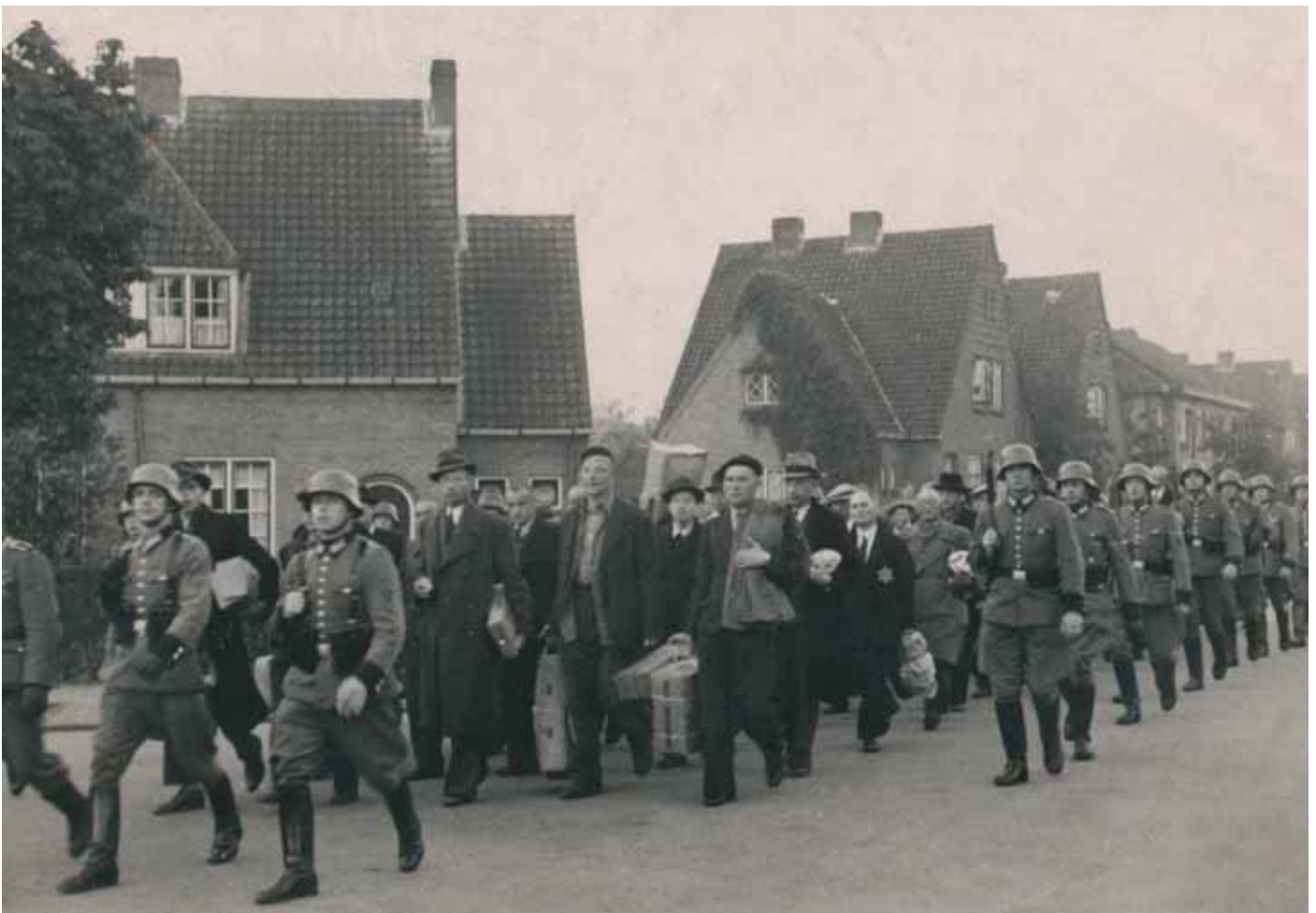
Het transport in 1944.