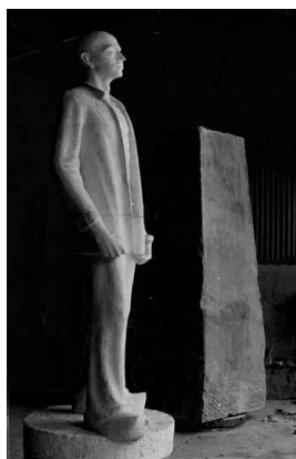
Het in drie segmenten opgebouwde gipsrelief van de Stenen Man.