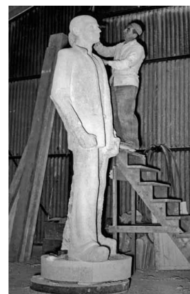
4 mei 1953 de beeldhouwer aan het werk.