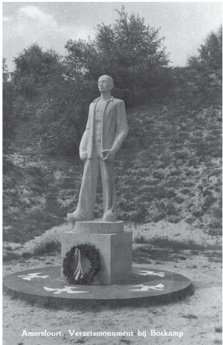
Amersfoort. Verzetsmonument bij Boskamp