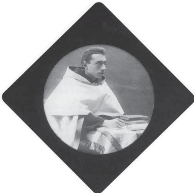
Titus Brandsma als priesterstudent in Boxmeer