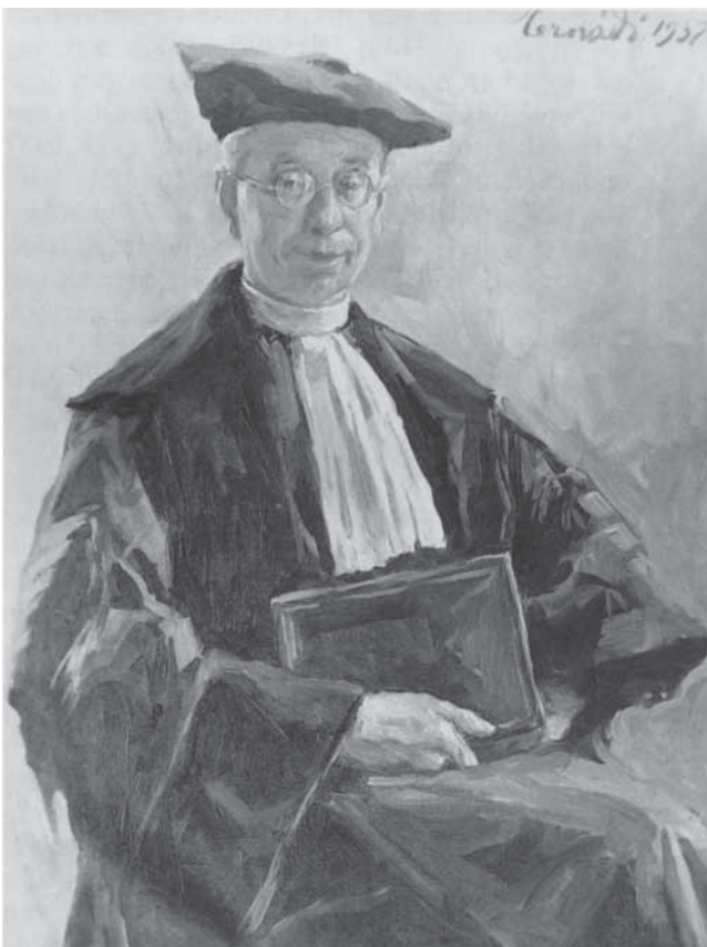
Een foto van het in 1937 door de kunstenaar Hernadi gemaakte olieverfschilderij van Titus als rector-magnificus. Het schilderij hangt heden ten dage in de Katholieke Universiteit van Nijmegen

Op 12 juni 1942, de dag vóór zijn transport naar Dachau, schreef Titus zelf nog een verzoekschrift aan de Duitsers. In dit schrijven had hij het niet over zijn psyche. Terecht vreesde hij dat dit bij de onbarmhartige nazi-autoriteiten zou leiden tot een averechts resultaat. In de eindredactie begon het verslag met een nauwkeurig overzicht van zijn algemene zwakte, de maagbloeding en de urine-infectie, waaraan hij reeds jaren leed. Daarbij noemde Titus de goede zorgen die de