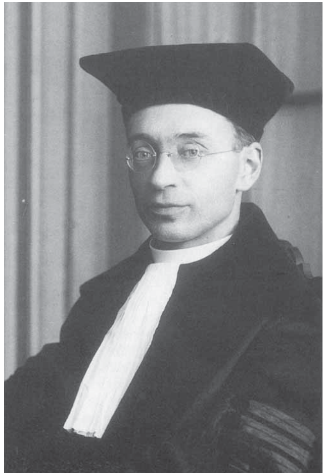
Titus als professor in 1923

In zijn verweerschrift stelde hij dat het nationaal-socialisme in Duitsland kon ontstaan, omdat daarmee een economische ineenstorting kon worden voorkomen. In eigen land golden voor de N.S.B. geen economische, maar enkel ideële gronden. Titus benadrukte het antinationale karakter van de beweging en hun innerlijke zwakheid. De leiding faalde door het gemis aan zowel aanleg, als vorming. Voorbijgaand aan de werkelijkheidszin van het Nederlandse volk kwam de partij in botsing met haar godsdienstzin. Daarmee werd het sterk christelijke karakter van de natie miskend. Toen zij haar eigen programma niet kon realiseren en de hulp van Duitsland inriep, krenkte de organisatie bovendien het besef van nationale waardigheid. Hoewel Titus hard was in zijn oordeel en zonder enig mededogen, kende hij geen haat, niet tegen de Duitsers, noch tegenover afzonderlijke leden van de nationaal-socialistische partij. Aan het einde van zijn verklaring voor de Sicherheitsdienst eindigde hij het verweerschrift met een gebed om verzoening.