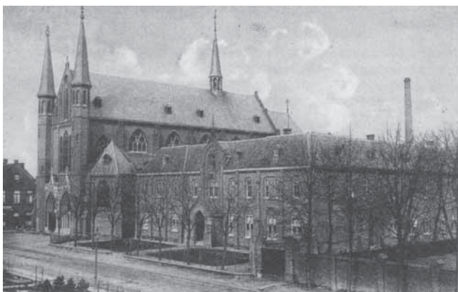
Titus woonde van september 1903 tot september 1923 in het klooster van de Karmelieten in Oss