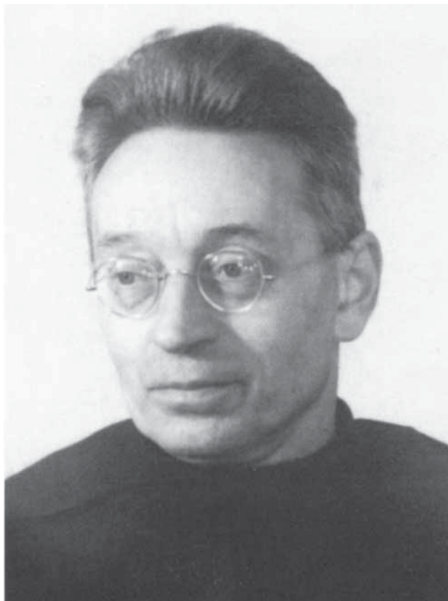
Een foto van Titus uit 1940

In de loop van de jaren hebben oud-gevangenen vaak nog gesproken over hun ontmoetingen met pater Titus Brandsma. Ze kenmerken hem als een beminlijk mens. Open en verstaanbaar naar gewone mensen, rationeel, en redenerend als hoogleraar naar zijn studenten. Wat we vooral ook niet mogen vergeten is het feit dat pater Titus Brandsma vooral ook betrokken was bij het netwerk van kranten van Rooms-katholieke signatuur. Tot het laatst toe ijverde hij er voor de nazi-propaganda daar buiten te houden en de eigen boodschap zuiver,