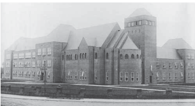
In 1923 werd in Oldenzaal het Lyceum opgericht