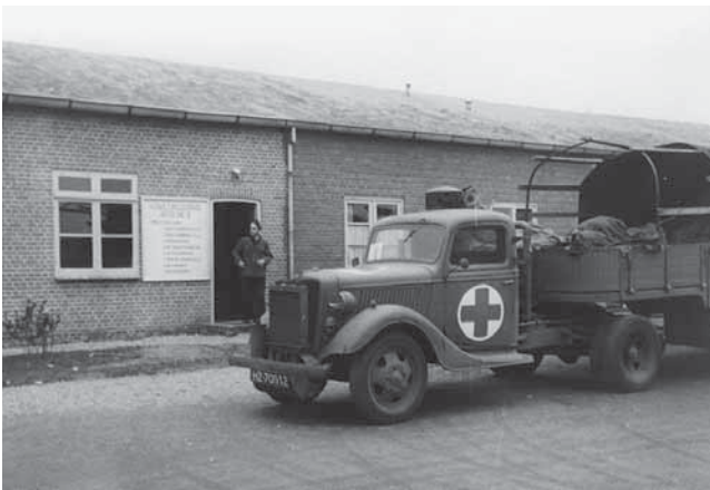
Het Rode Kruis arriveert met pakjes in het PDA

De pakketten werden gereedgemaakt op de zogenaamde smeerstations. Een aantal smeerploegen werkte buiten Amersfoort in plaatsen als Utrecht, Zeist, De Bilt en Soesterberg. Vervolgens werden de gesmeerde boterhammen daar in papieren zakken verpakt en dan, meestal op woensdag, naar het huis van mevrouw Van Reede gebracht, waar ter plekke ook nog eens duizenden boterhammen werden belegd. Vrijwilligers begonnen er woensdagnacht tegen vieren al met het snijden van de broden. Tenslotte werden alle pakketjes op vrachtauto's geladen en naar het kamp vervoerd. Van Overeem, die dit geheel coördineerde en die het Amersfoortse comité met andere comités in contact bracht en waar nodig adviseerde, kwam pas naar de woning van mevrouw Van Reede wanneer de volgeladen vrachtwagens daar al voor de deur stonden.