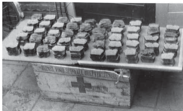
Boterhammetjes in de Dienst voor Speciale Hulpverlening

Na aanlevering van de producten kwam het aan op de verwerking en verpakking daarvan. In het najaar van 1943 waren er medewerkers en producten genoeg om op gezette tijden pakketten met boterhammen voor de gevangenen klaar te maken. Aanvankelijk was het streven erop gericht eens in de twee weken pakketten klaar te maken; later kwam, op basis van de planning van Loes van Overeem, iedere vrijdagmiddag om vijf uur een transport in het kamp om ze af te leveren. Wilde een organisatie als deze goed lopen, dan moest alles op tijd klaar zijn en diende het geheel strak geregisseerd te worden. Geen gemakkelijke opgave. Ging het niet linksom, dan moest het rechtsom. Bevatte een pakket in het begin acht boterhammen, tenslotte werden het er achttien: besmeerd, belegd en ingepakt.