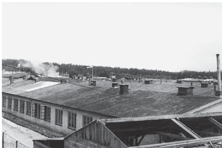
Zicht op het PDA vanaf een der wachttorens