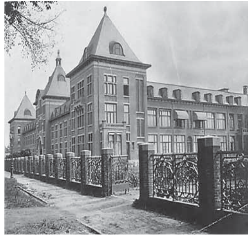
Het St. Ignatius Ziekenhuis te Breda