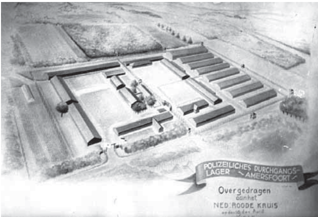
Plattegrond van het PDA: Fresco in de kamer van de commandant.

teerd dat de ruimte in de reguliere justitiële inrichtingen te beperkt bleek. Om alle gevangenen te kunnen opsluiten werd door de leiding van de Sicherheitspolizei en de SD besloten om in Nederland nieuwe gevangenenkampen in te richten. Het al bestaande barakkenkamp Schoorl was al als zodanig in gebruik. Voorjaar 1941 werd echter besloten om op een geschiktere plaats een ander gevangenenkamp in te richten. In mei 1941 viel de keuze op het voormalige mobilisatiekamp De Boskamp. Besloten werd om daarvan een concentratiekamp te maken. De opbouw daarvan duurde tot augustus 1941. Eenmaal gereed, arriveerde op maandag 18 augustus 1941 de eerste groep van 195 gevangenen uit Schoorl. Kamp Amersfoort kreeg de bestemming Polizeiliches Durchgangslager en werd aangeduid als Polizeiliches Durchgangslager Amersfoort .