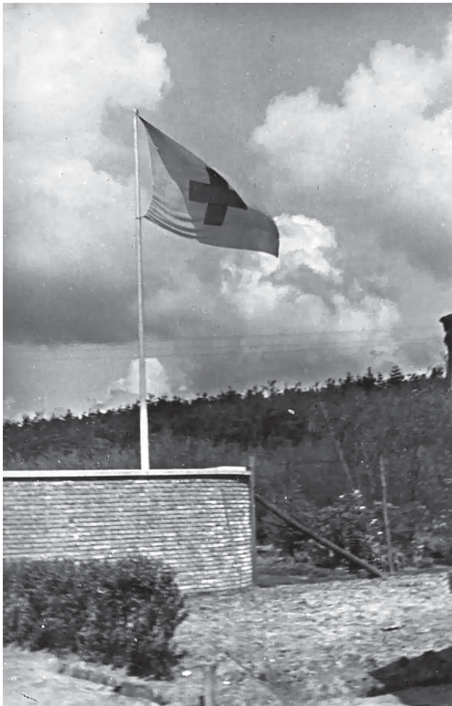
De Rode Kruisvlag wappert vanaf 20 april 1945 boven het PDA bij de hoofdwach

Een gek voorval, wat ook niet iedereen kan waarderen, was, terwijl ze elkaar aan het beschieten waren en de prinses jarig was. Die commandant van de Duitsers die kwam nog wel eens het een en ander vragen en op een dag zei ik tegen hem: nu heb ik eens een verzoek aan u: onze prinses is vandaag jarig en zou u met wat saluutschoten willen afschieten? Toen zegt hij: maar we hebben wapenstilstand dus dat kan helemaal niet..."