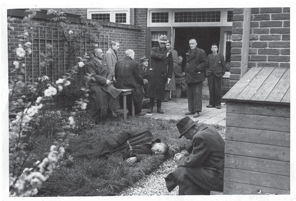
Ontslagen gevangenen worden verzorgd in het huis aan de Soenbastraat. Een deel uitgeput

Archief Eemland Amersfoort Archief Fraters CMM, Tilburg. Archief Gedenkplaats Haaren Archief Nationaal Monument Kamp Vught Bureau voor Geschiedschrijving, Rob Wolf, Nijmegen Defensie Interservice Commando / Commando Diensten Centra, Kerkrade Koninklijke Bibliotheek Den Haag Nationaal Archief Den Haag Nederlands Instituut Militaire Historie Den Haag NIOD Amsterdam Medische Bibliotheek Utrecht/MBU Ministerie van Justitie, Afd. Doc. Informatievoorziening, Semi-statisch archief, Den Haag Oorlogsarchief Nederlandse Rode Kruis Den Haag Regionaal Archief West-Brabant Stadsarchief Breda Stadsarchief 's-Hertogenbosch