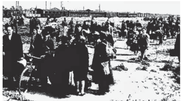
Evacués uit Breda onderweg