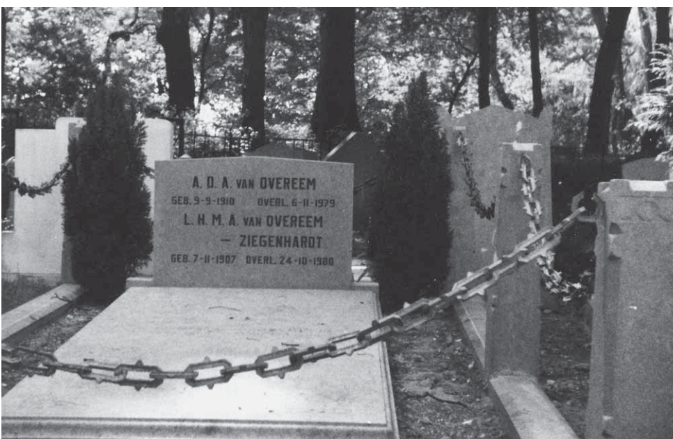
Begraafplaats Zaltbommel waar het echtpaar Van Overeem-Ziegenhardt begraven ligt