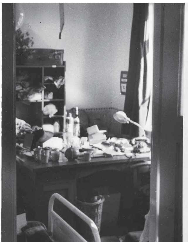
Kamertje waar Loes van Overeem in het PDA 9 maanden in huisde

Eenmaal in het kamp stelde Van Overeem kampcommandant Berg voor een voldongen feit. Ze weigerde het