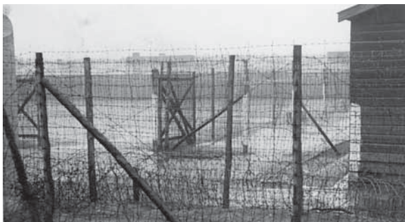
Regendag in het PDA