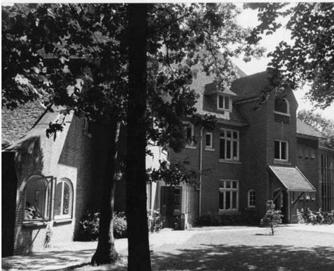
Meijboomlaan 1: Politie school van 1955-1968