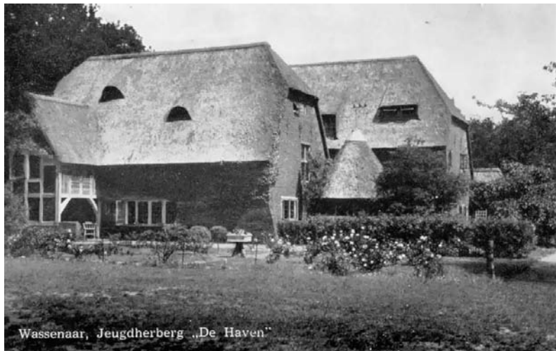
Wassenaar, Jeugdherberg „De Haven“

gemeentepolitie. Amsterdam, Den Haag en Rotterdam hadden al voor 1940 eigen opleidingsscholen. Die van Amsterdam werd in 1970 opengesteld voor geheel Noord-Holland. Daarnaast kwamen er regionale scholen voor de gemeentepolitie in Heerlen, Lochem, Wassenaar (Leusden).