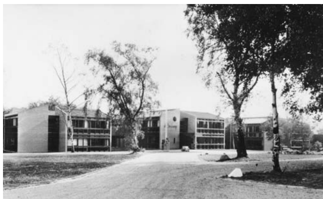
Nieuwbouw "De Boskamp" anno 1971.