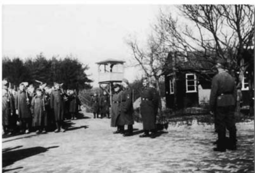
Het Joden- of Strafkommando, ook wel Schietbaancommando genoemd, staat aangekleed. Deze gevangenen groeven de voormalige schietbaan tevens executieplaats uit. Door de zwaarte van het werk en de vele individuele mishandelingen was dit het meest beruchte werkkommando.

Stichting Nationaal Monument Kamp Amersfoort