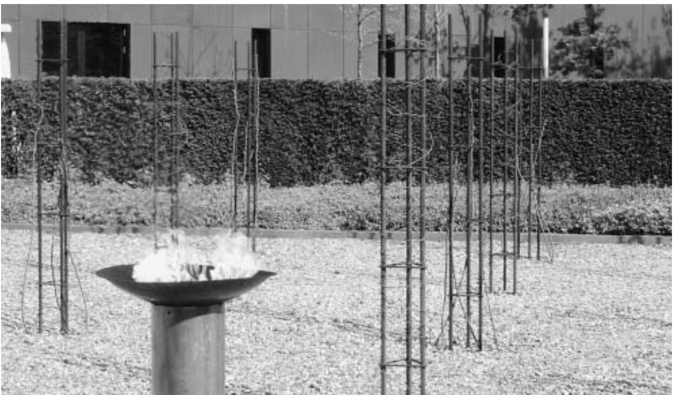
Bevrijdingsvuur 2005