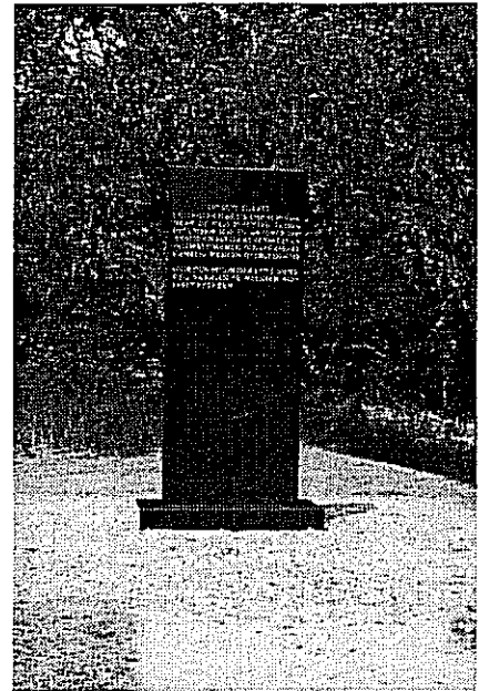
Monument Kamp Schoorl