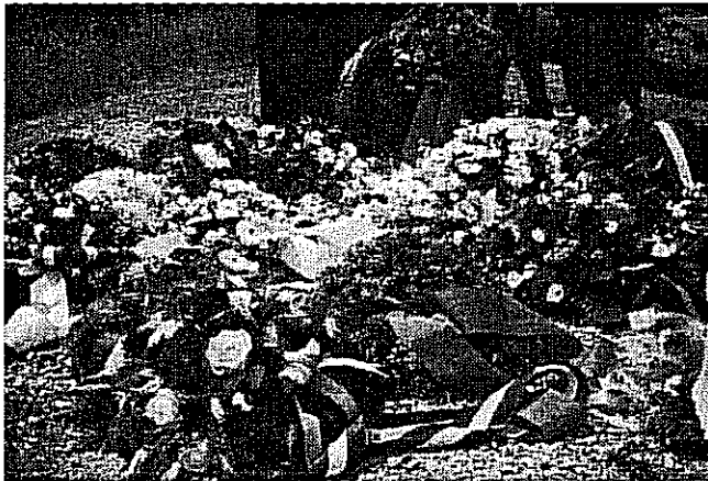
na de herdenking

In augustus 1941 werden de eerste gevangenen in Kamp Amersfoort binnengebracht. Zij kwamen uit het Kamp Schoorl dat daarna snel werd afgebouwd en gesloten. Jaarlijks wordt op 11 juni bij het sobere Monument Kamp Schoorl een herdenking gehouden.